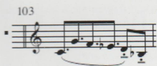
Afb. 2: In the Beginning, m.103

een stijl op de muziek geplakt zou moeten worden, zou dat funk worden. Het eerste